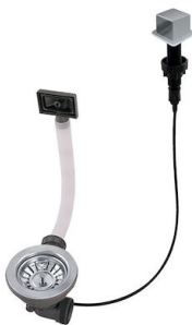
Desagüe automático LIRA 8407 103